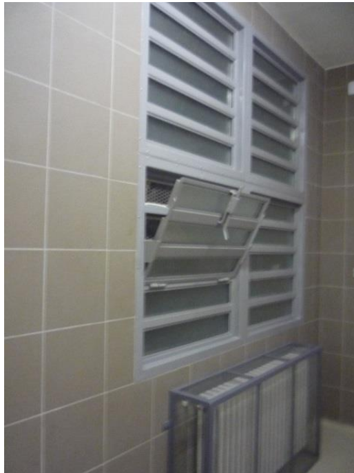
(7) Salgótarjáni Rendőrkapitányság előállító helyiség biztonsági ablakai