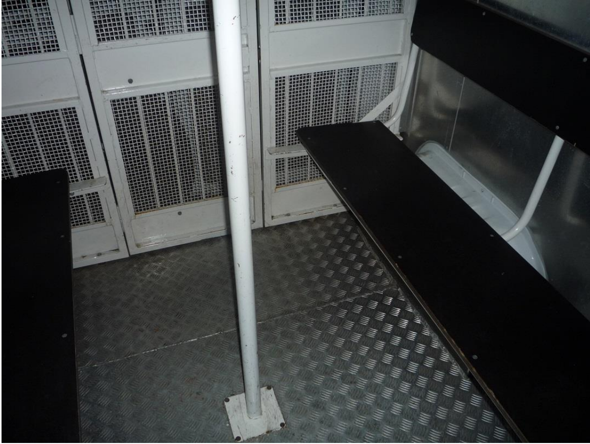
(5) Fogvatartotti ülésér – zárkarész - kapaszkodóval, biztonsági öv nélkül a szállítójárműben