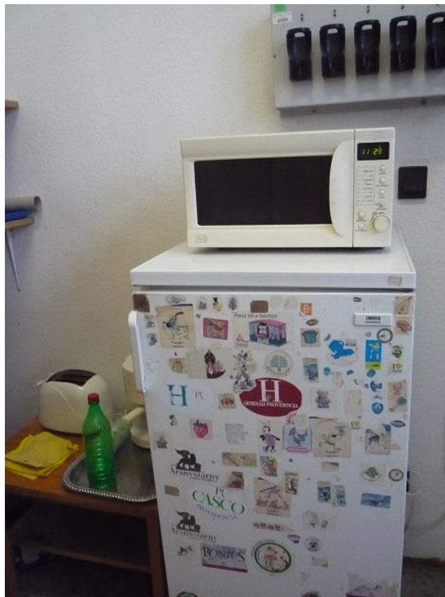
(9) Balassagyarmati Rendőrkapitányság öltözőhelyiség