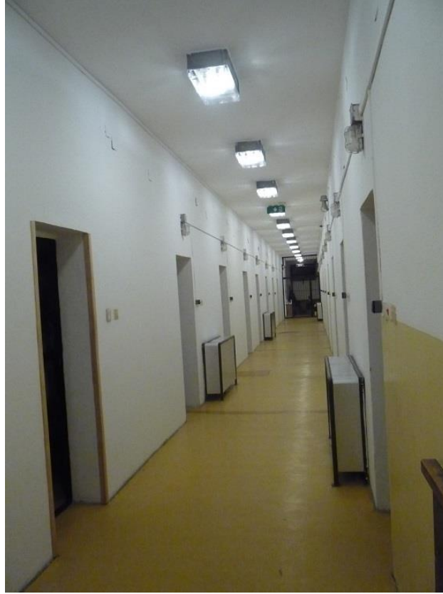
(1) Nógrád Megyei Rendőr-főkapitányság Központi Fogda folyosó