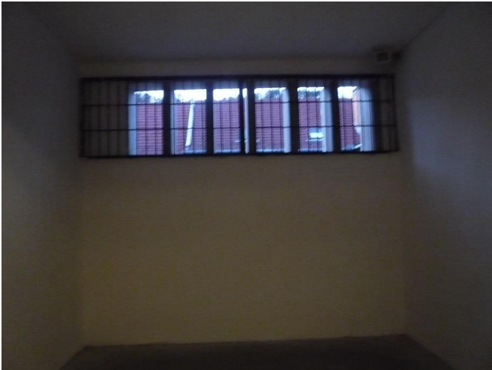
(4) Nógrád Megyei Rendőr-főkapitányság Központi Fogda sétáló helyiség