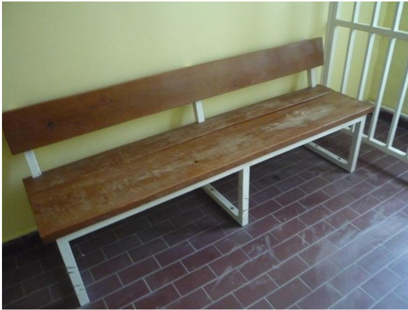
(8) Balassagyarmati Rendőrkapitányság előállító helyiség