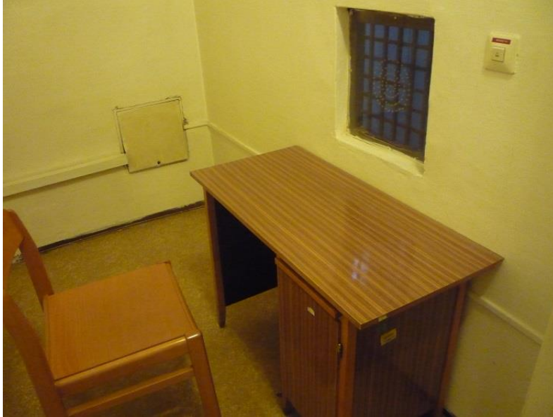
(3) Nógrád Megyei Rendőr-főkapitányság Központi Fogda ügyvédi beszélő