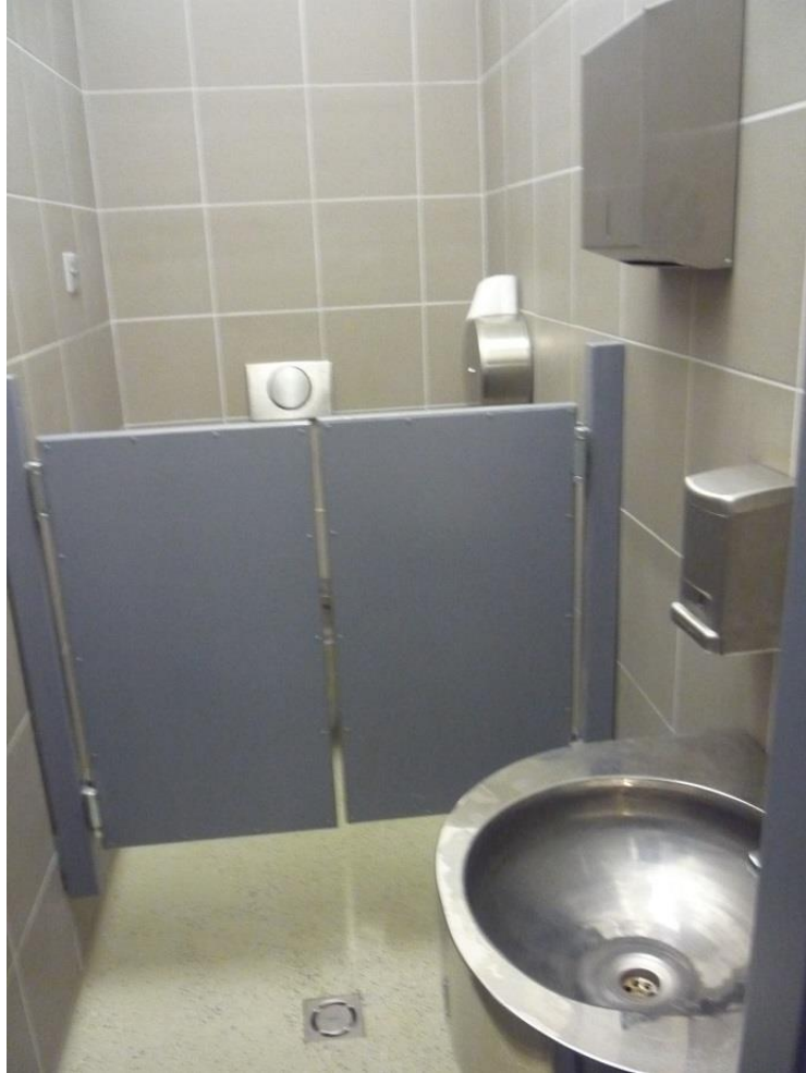
(6) Salgótarjáni Rendőrkapitányság előállító egység mosdója