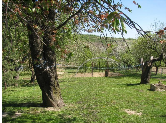
11. kép. A nagy udvar, művelésében a gyermekek is részt vesznek