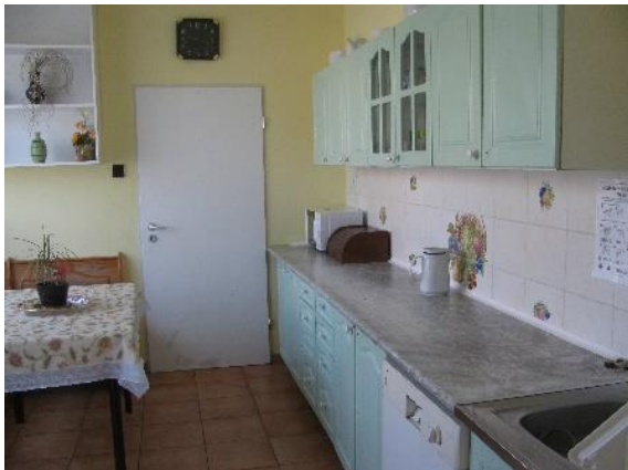
7. kép Konyha, étkező Zircen