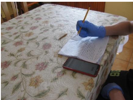
9. kép. Önálló tanulás mobil telefon segítségével a nappaliban