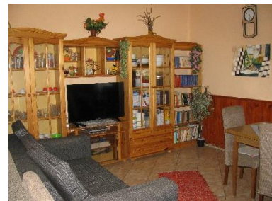
14. kép. Nappali Lókúton