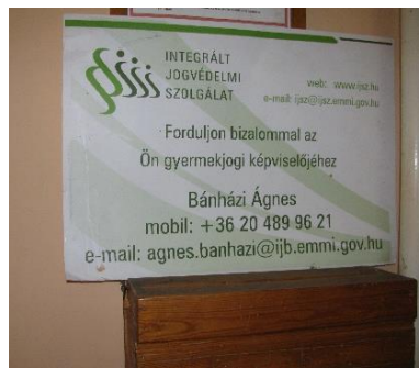
19-20. kép. Az Integrált Jogvédő Szolgálat tájékoztató anyagai