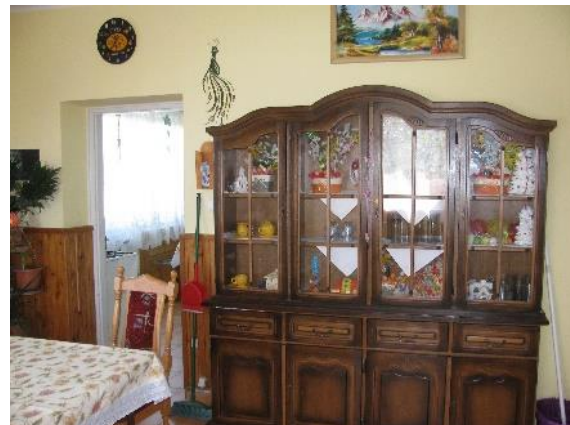
8. kép. Nappali Zircen