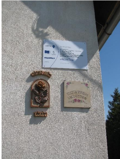
10. kép A lókúti Rózsa ház