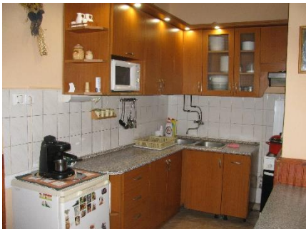
15. kép. Konyha Lókúton