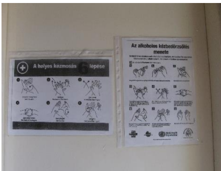
18. kép. A kézmosás szabályai