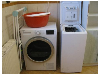
16-17. kép. Eszközökkel jól felszerelt vizesblokk, lepattogzott zuhanytálca