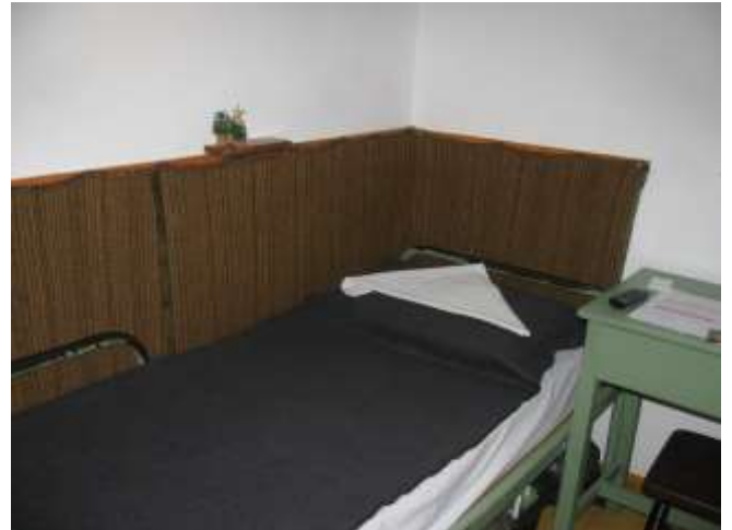
I/2. Lakóhelyiség a II. Objektumban – „B-C” körlet