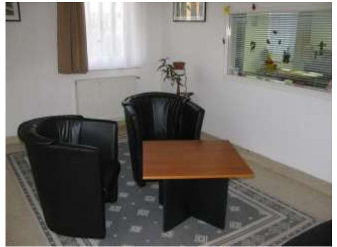
I/4. A gyermekláthatás lebonyolítására szolgáló helyiség a II. Objektum anya-gyermek részlegén