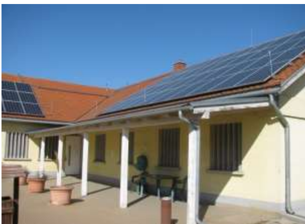
I/5. Fedett rész a II. Objektum udvarán