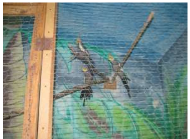
I/6. Terápiás állatok a fiatalokú férfiak körletén